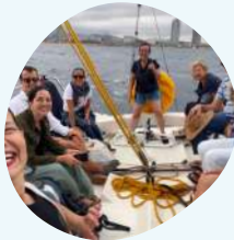
Veles per l'Alzheimer 14 de juliol