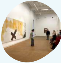
Visita a la Fundació Antoni Tàpies 14 de febrer