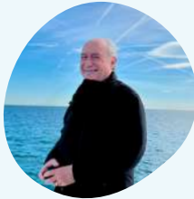
Sortim a navegar 31 de març