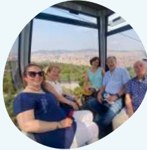
Telefèric la muntanya de Montjuïc 28 de juny